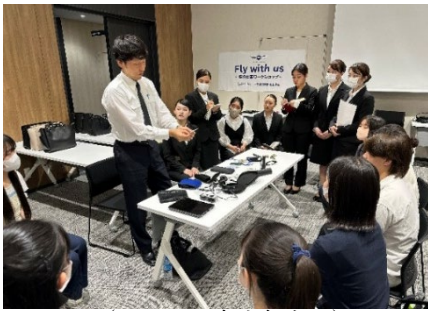
(子ども・青少年向け)